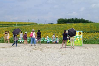
▲ ひまわりまつりの会場全景 (H27.8月撮影)