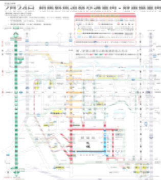
▲ 前売り券購入のお客様へ配布する案内チラシ