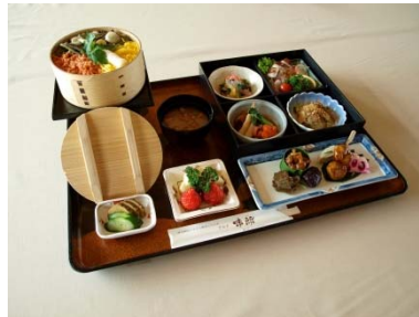
▲ 団体ツアー向けの夕食例 (変更となる可能性あり)