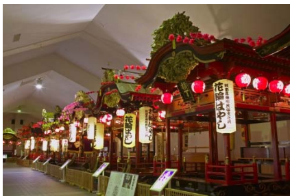
▲ 山車の展示会場全景 (H28.4月撮影)