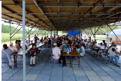
▲ 軽食・休憩会場全景 (H27.8月撮影)