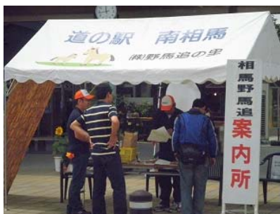
▲ イベント期間中の道の駅での会場案内 (H22.7月撮影)