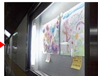
▲過去の地下道内掲示の様子