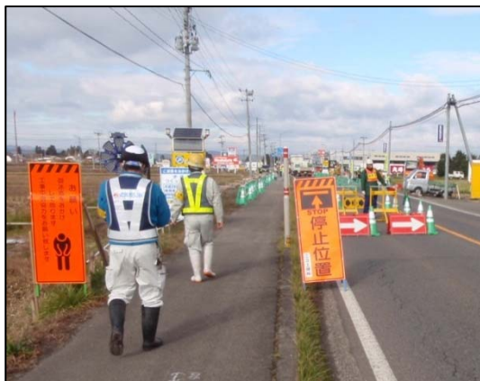
▲安全パトロールの様子