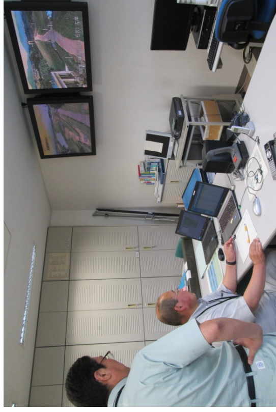
河川巡視・点検システムによる報告確認