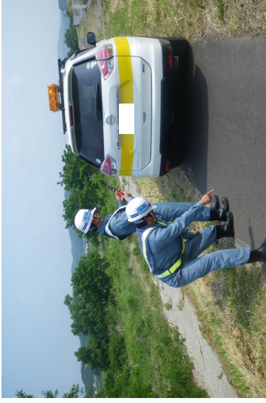
現地での被災状況の確認訓練