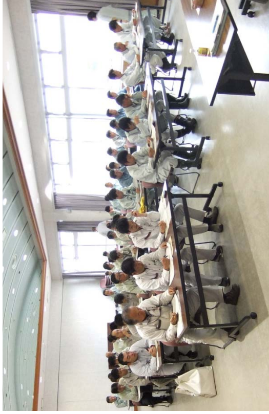
緊急時河川巡視講習会