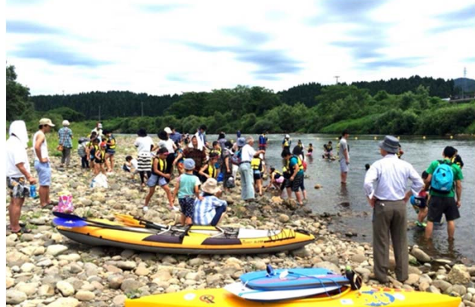
《初の最高評価五つ星 西滝沢水辺プラザ》