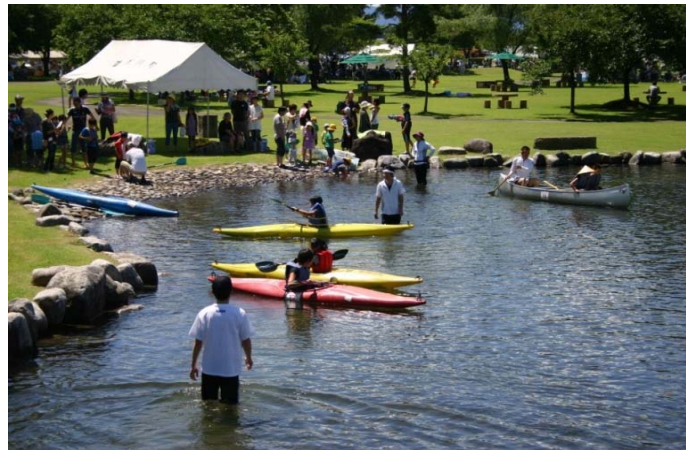
《2回連続の最高評価五つ星 雄物川河川公園》