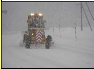
除雪グレーダによる作業状況