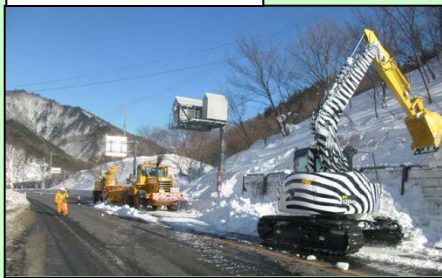
バックホウによる除去状況