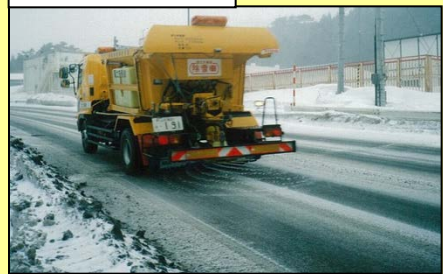
散布車による散布状況