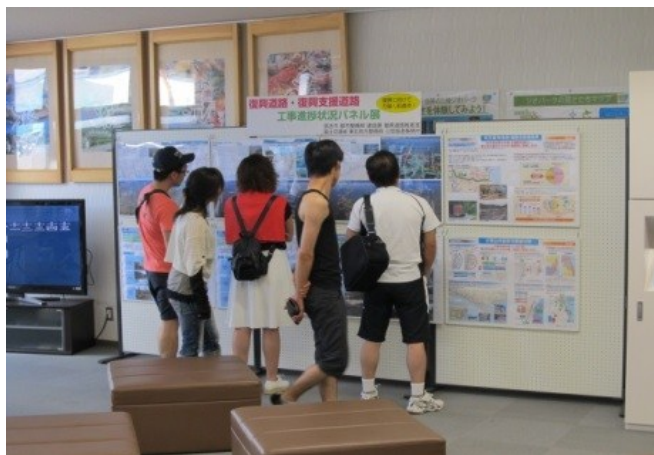
▲道の駅みやこ開催状況