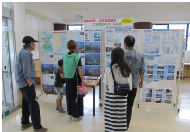
▲道の駅たろう開催状況