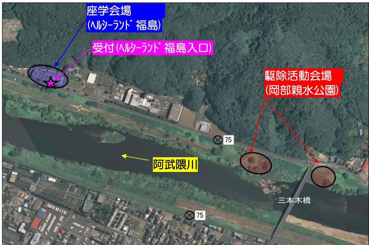
【イベント開催場所(座学、駆除活動)位置図】