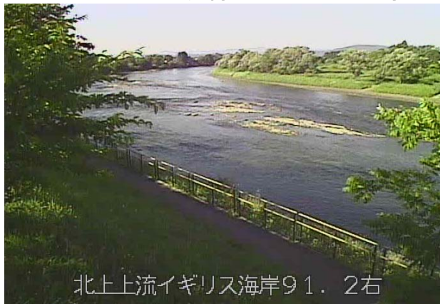
北上上流イギリス海岸91.2右