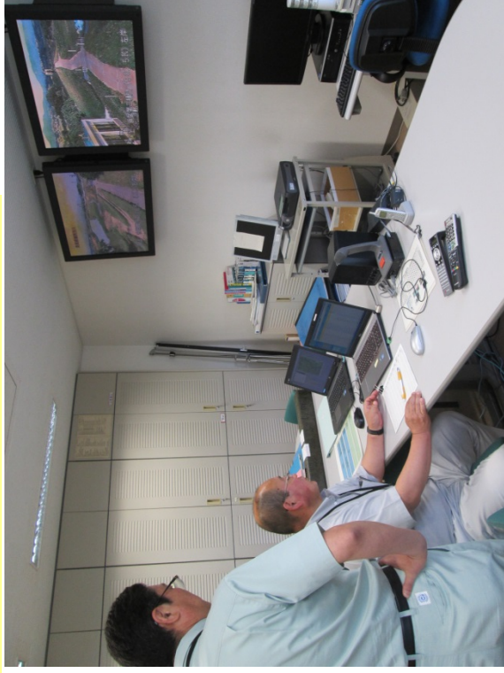
郡山出張所管内の実地訓練の状況（平成26年5月28日）