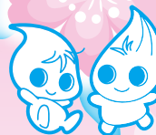
岩手県企業局キャラクター 「みずりん・みどりん」