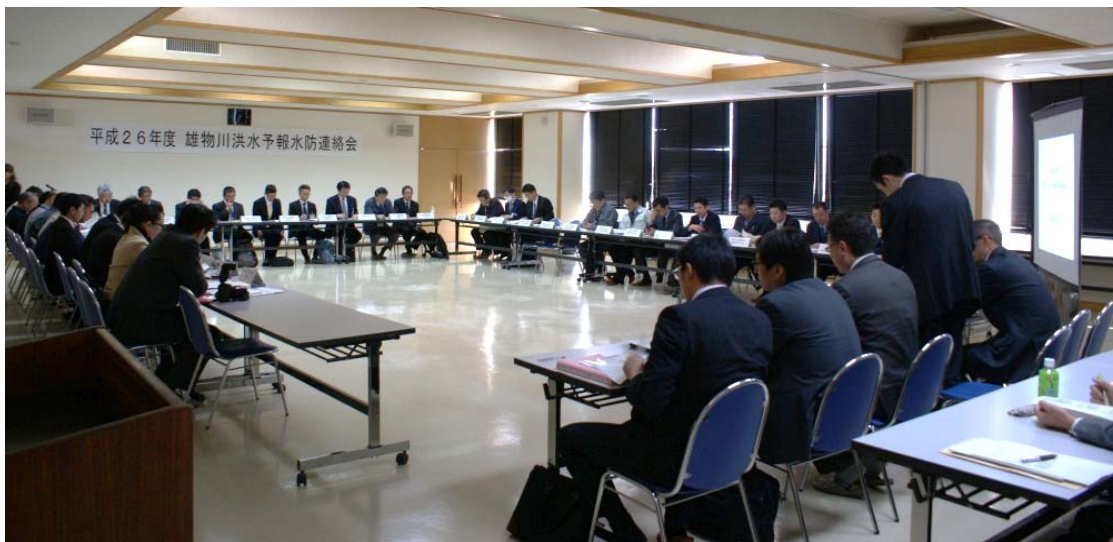
平成26年度 雄物川洪水予報水防連絡会の状況