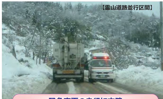
緊急車両の走行に支障