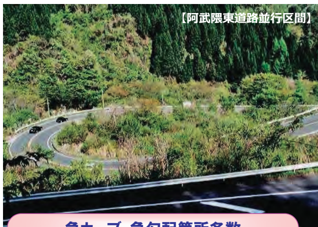
急カーブ・急勾配箇所多数