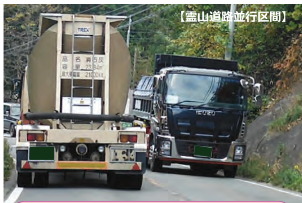
大型車同士のすれ違いが困難