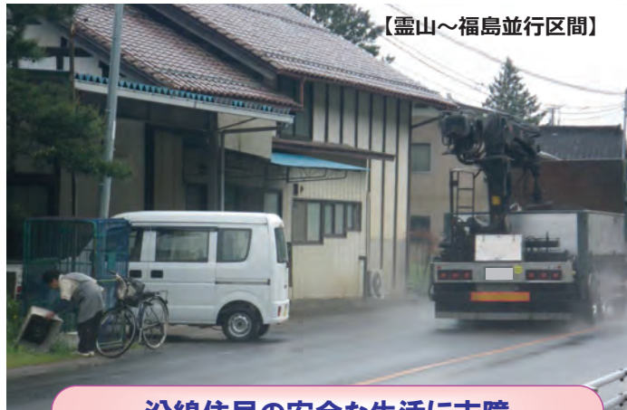
沿線住民の安全な生活に支障