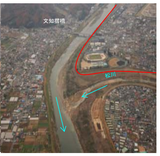
中央地区除染範囲 L=6.8km