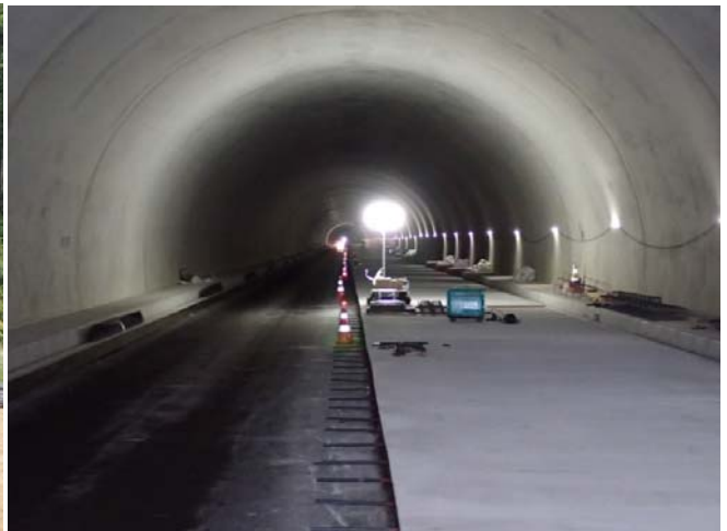
平成26年12月 撮影(現在の中の様子)