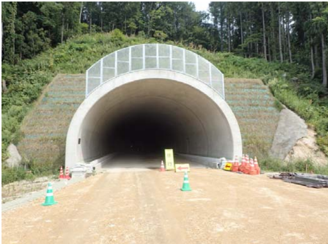
平成26年9月 撮影(着手時)