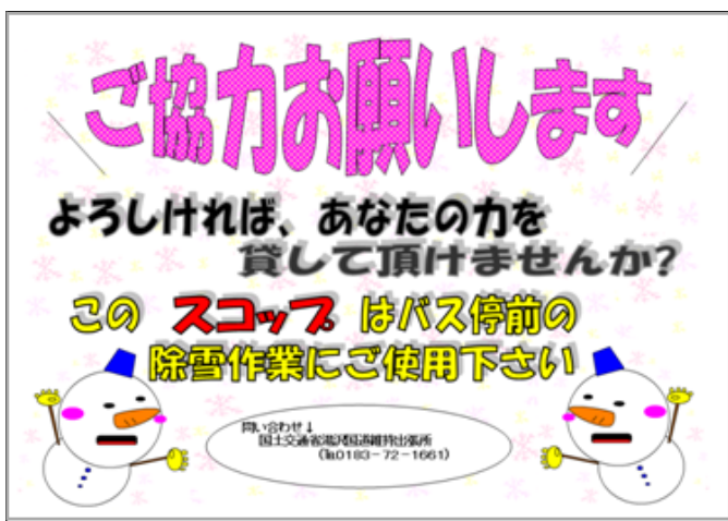
図. 協力依頼ポスター