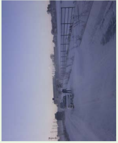
地吹雪により身動きが取れなくなった車両