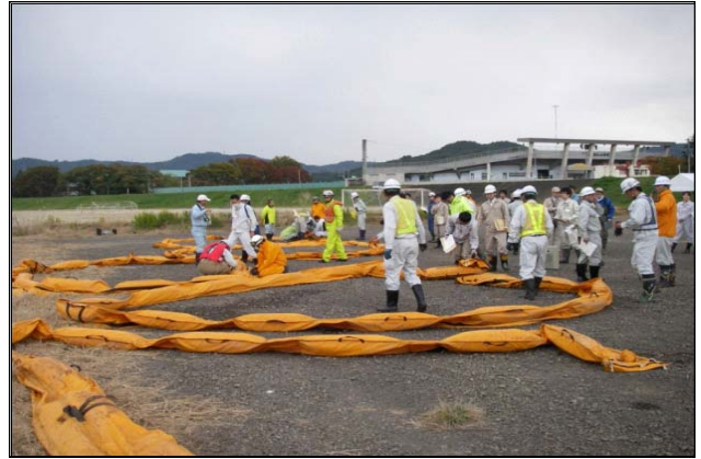
オイルフェンス接続訓練