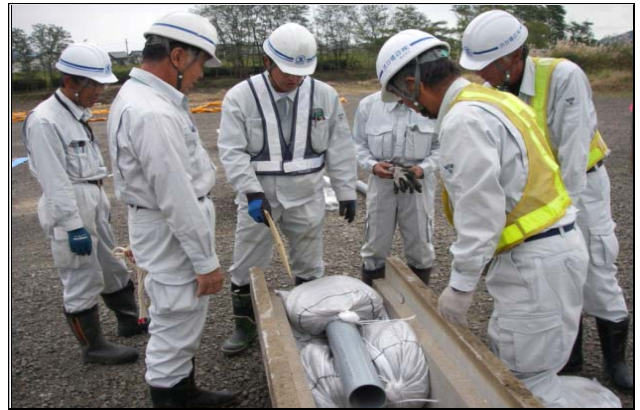
側溝油流出防止訓練