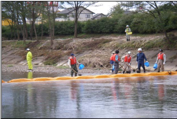
河川横断展張、油回収訓練