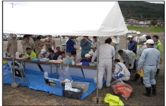
簡易パックテスト、臭気確認訓練