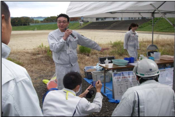
水質、薬品類の説明