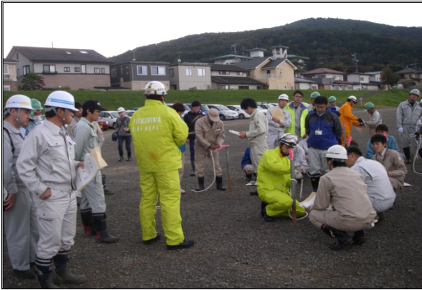
ロープワーク訓練