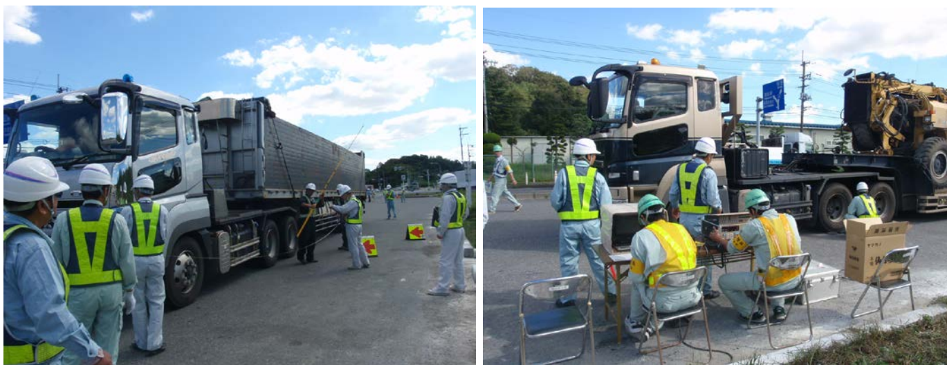
・特殊車両の寸法や重量の測定及び、通行許可証等の確認

〈 発表記者会： 宮城県政記者会、東北電力記者クラブ、東北専門記者会、石巻記者クラブ 〉