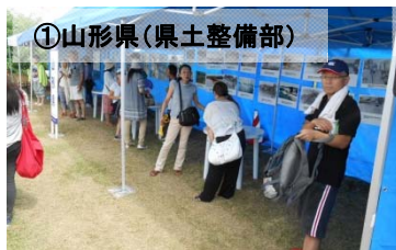
①山形県(県土整備部)

目的： 地域住民に河川事業、ダム事業の役割を周知するとともに、防災・河川愛護の意識醸成を図り、理解を深める。 開催日時： 平成26年9月14日(日) 9:00~15:00 開催場所： 馬見ヶ崎川(双月橋上流 右岸)※日本一の芋煮会フェスティバル会場内 参加機関： 山形河川国道事務所／山形地方气象台／山形県／美しい山形・最上川フォーラム