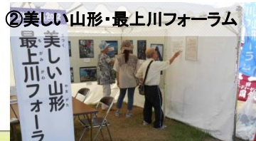
②美しい山形・最上川フォーラム

「身近な水辺と人々のいとなみ」がテーマの水辺の四季写真コンテスト入賞作品を展示。