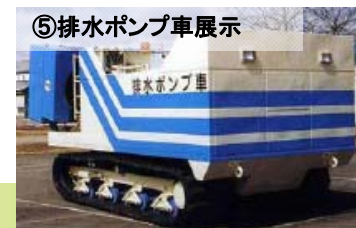
⑤排水ポンプ車展示