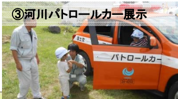
③河川パトロールカー展示

「身近な水辺と人々のいとなみ」がテーマの水辺の四季写真コンテスト入賞作品を展示。