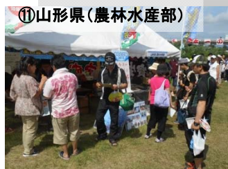
⑪山形県(農林水産部)