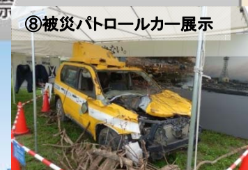
⑧被災パトロールカー展示