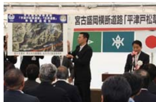
▲岩手河川国道事務所長による 事業経過報告