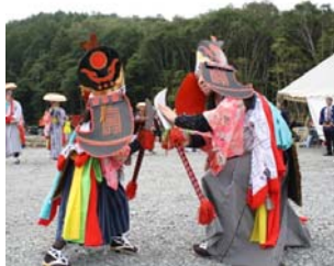
▲オープニングセレモニー 「田代念佛剣舞」