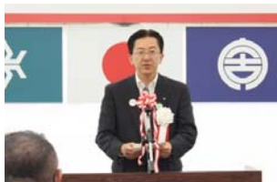
▲岩手県知事による挨拶