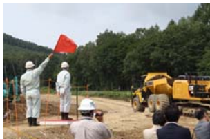
▲岩手河川国道事務所 建設監督官の着工指示で動き出した建設機械