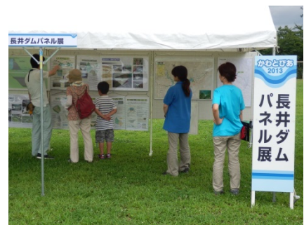
平成25年、26年の大雨や長井ダム に関するパネルを展示したパネル展 (小中学生向けに最上川について 説明したパネルも展示。)