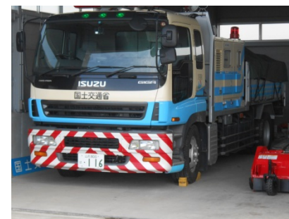
60m³/sの排水ポンプ車展示 (搭乗可)