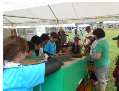
土石流の仕組みを学べる 土石流模型実演