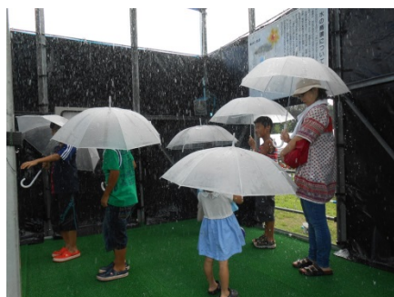
最大200mm/hの雨量が体験 できる降雨体験