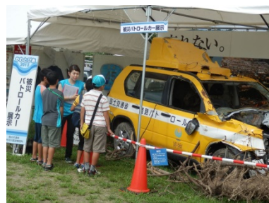
東日本大震災で被災した パトローカー及び震災に 関するパネル展示