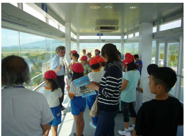
北上川学習交流館「あいぽーと」の展望室からXバンドMPLレーダーを見学