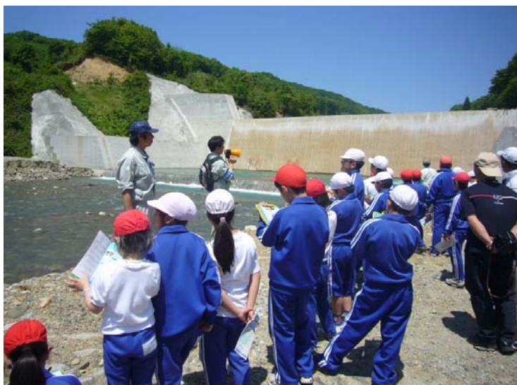
市野々原2号堰堤で、実際の堰堤を見てその大きさを確認