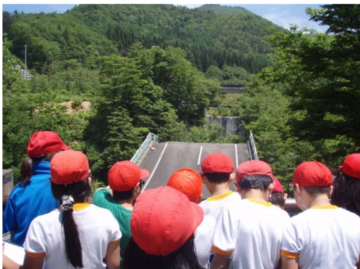
岩手・宮城内陸地震の祭時被災地にて、自然災害の恐ろしさを学習