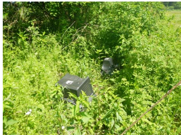
②一関市狐禅寺字川岸場地先(ベッド、加湿器、ビデオデッキ等)