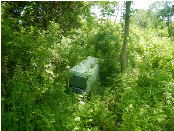
①一関市狐禅寺字田谷下地先(冷蔵庫、テレビ)