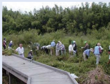
ビオトープの整備