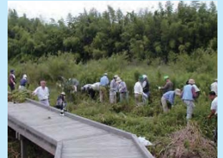
ビオトープの整備