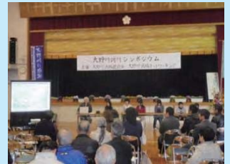
シンポジウムの開催