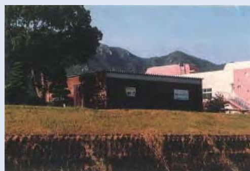
市民団体による活動拠点の整備事例 (佐波川)