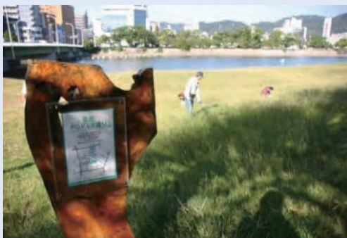
市民団体による看板設置事例 (太田川)

これらの河川法上の許可等について、河川管理者との協議の成立をもって足りることとなります。