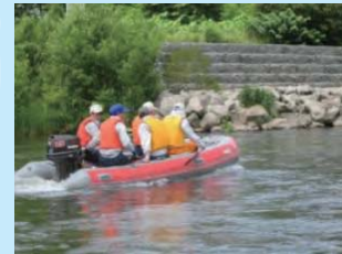
船による河岸の情報収集等