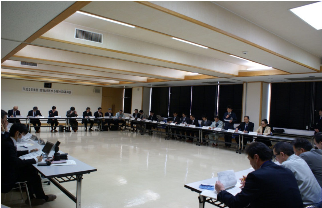
平成25年度の雄物川洪水予報水防連絡会の状況