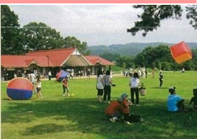
風の草原 H20.5オープン