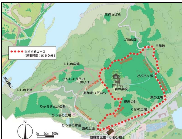
里山地区主要部平面図(42.9ha)