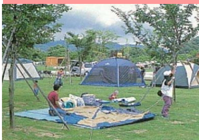
エコキャンプみちのく H15.7オープン