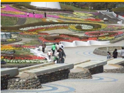
彩りのひろば H1.8オープン