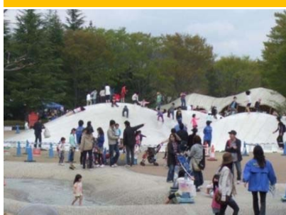
わらすこひろば H3.4オープン