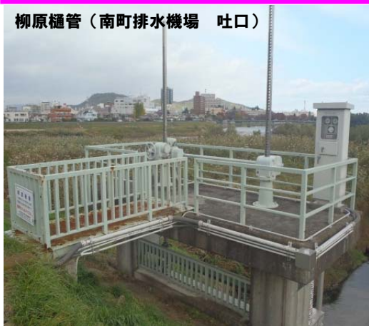
柳原樋管 (南町排水機場 吐口)