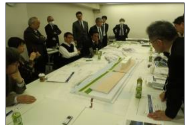
模型を用い、デザインを検討