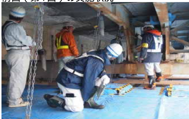
パトロールの様子