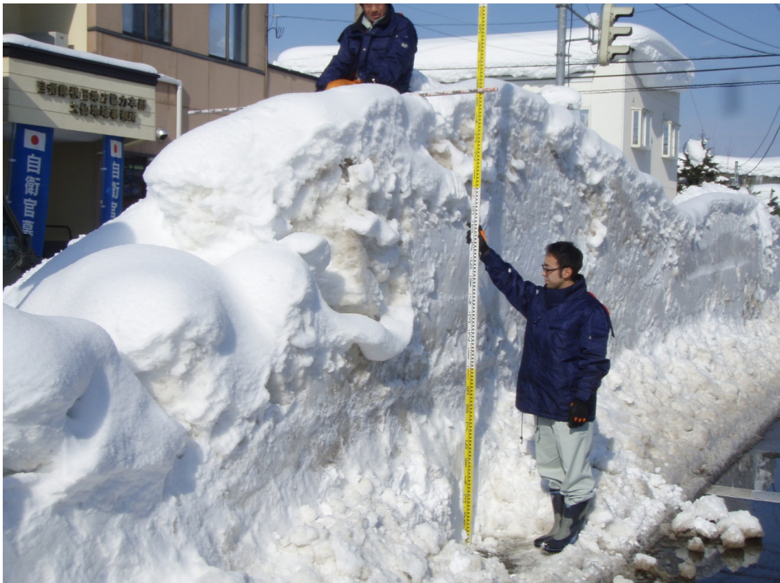
【大仙市内の堆雪状況】