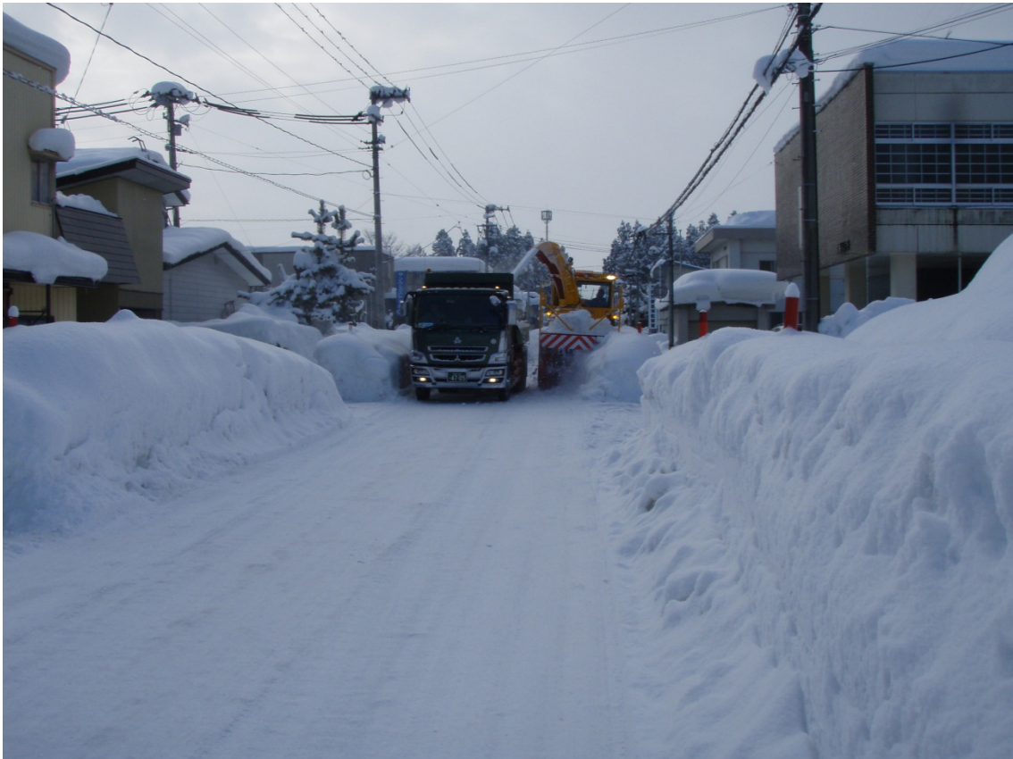
【大仙市内の除雪状況】