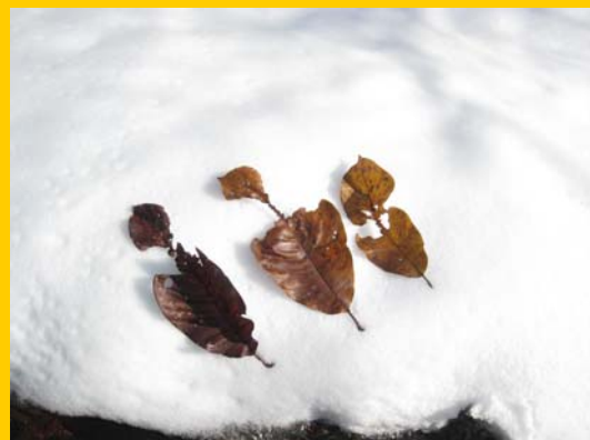
フィールドサイン（食痕）