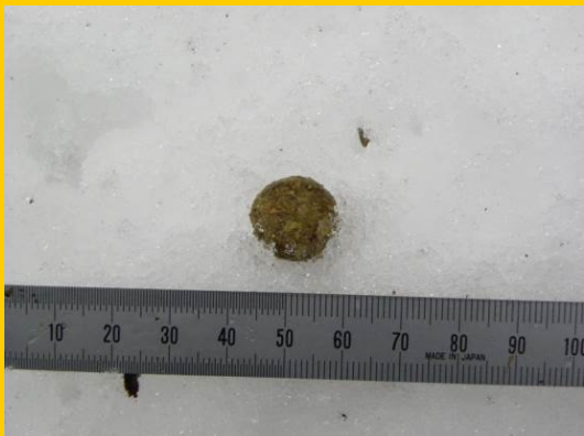
フィールドサイン（糞）