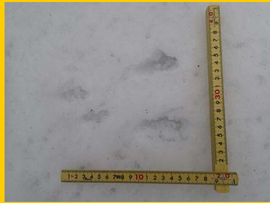
フィールドサイン（足跡）