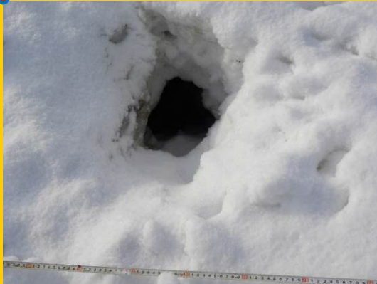
フィールドサイン（巣穴）