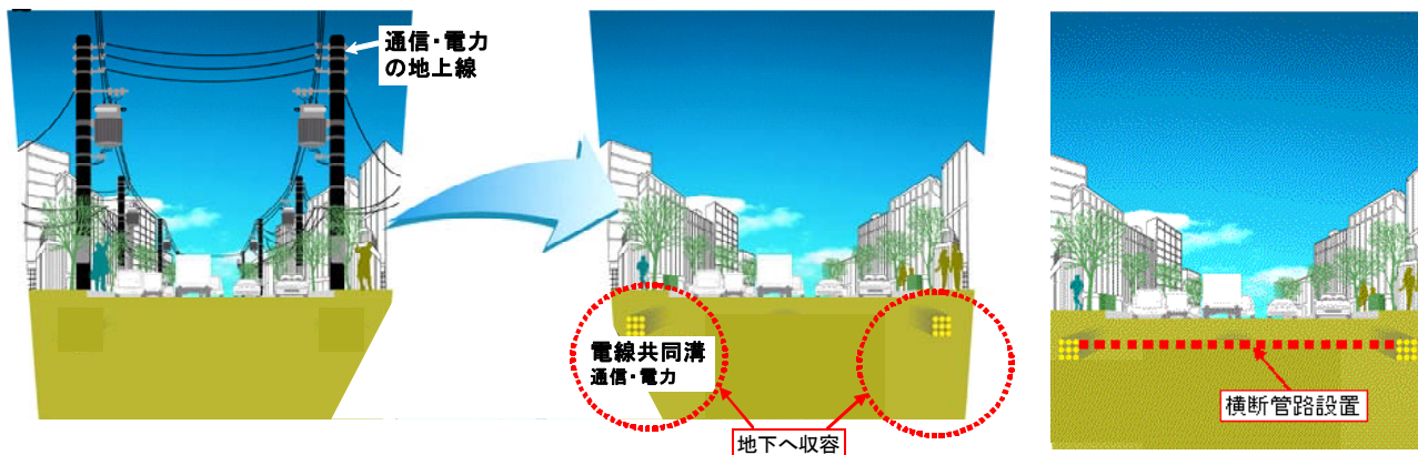
電線共同溝工事のイメージ

現在、国道4号上り線（延長約100m）の歩道下に光ファイバー・電気・通信ケーブル等を共同収容するための管路を設置しています。下り線については施工が終わっています。今後、下り線の管路と上り線のそれを接続する工事を実施します。横断管路の延長は20mです。交通量の多い一般国道4号を横断するために、夜間の通行規制を必要とします。