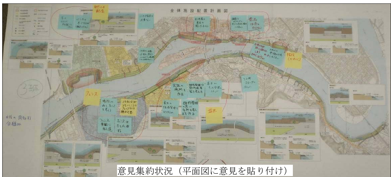
意見集約状況（平面図に意見を貼り付け）