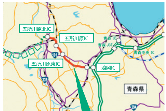
津軽自動車道 五所川原北IC～浪岡