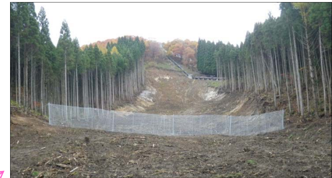
■ 落石防護柵 (延長約40m、高さ約3m)