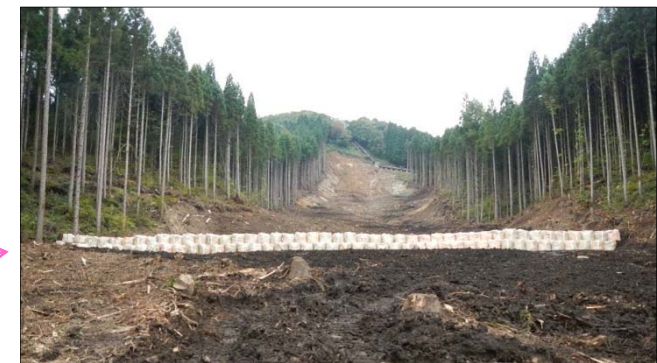
■ 大型土のう (延長約50m、2段積、135袋)