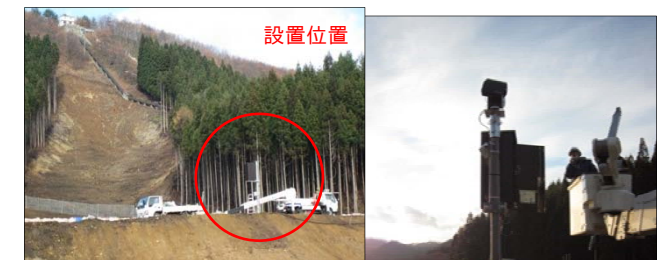
■ 監視カメラ (地上高さ約4m)