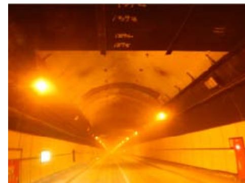
天井板撤去後の状況