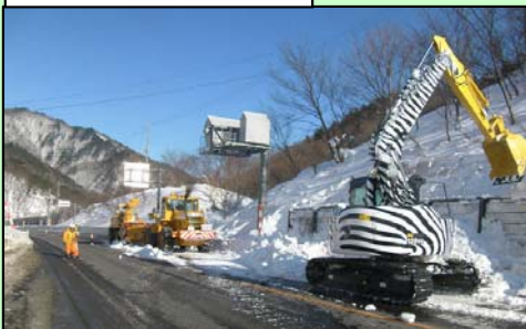
バックホウによる除去状況