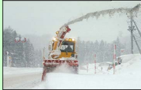
ロータリー除雪による作業状況