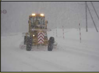
除雪グレーダによる作業状況