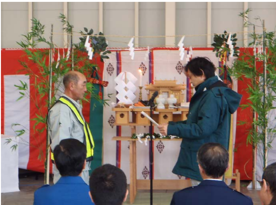
＜除雪従事功労者表彰＞