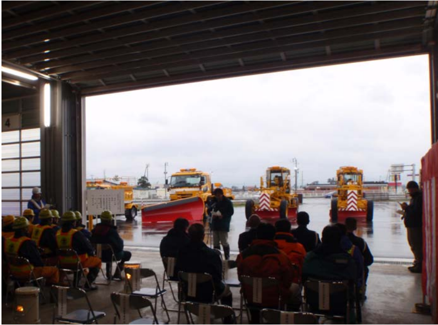
＜湯沢河川国道事務所長挨拶＞