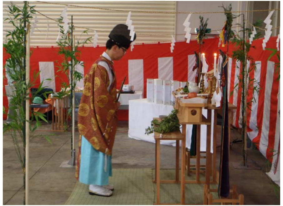
＜安全祈願式（請負者主催）＞