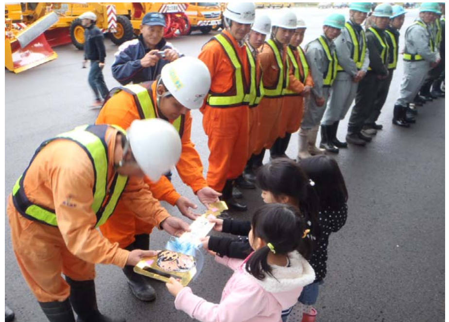
＜幼稚園児から鍵の引き渡し＞