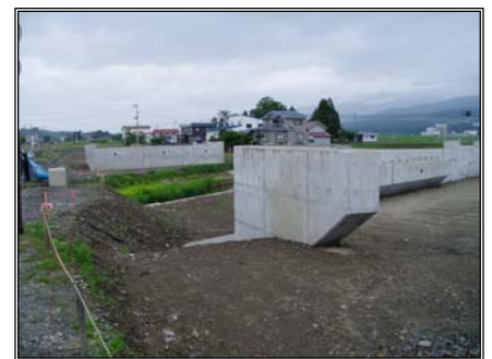
▲施工中の梅の橋下部工の様子