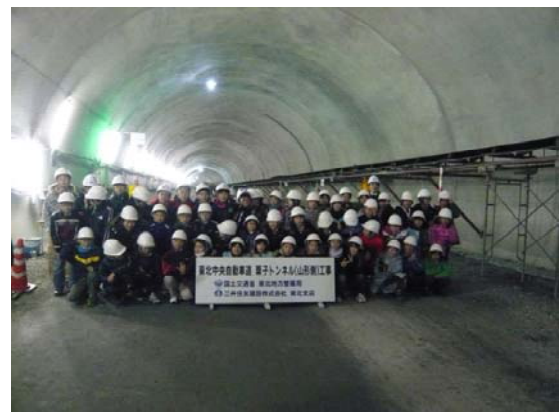
トンネル見学会の様子