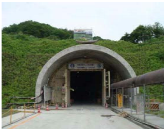
栗子トンネル山形側坑口

http://www.thr.mlit.go.jp/fukushima/touhoku_chuuou/index.html