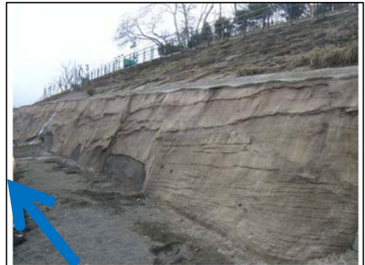
修景護岸状況（近景）