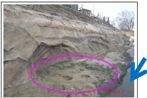
アケボノゾウの足跡化石