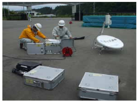
情報機器組立設置訓練状況