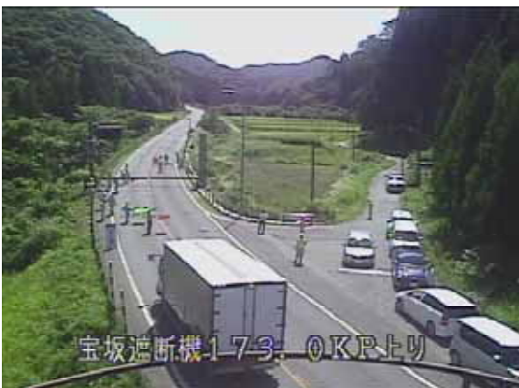
前回遮断機訓練全景