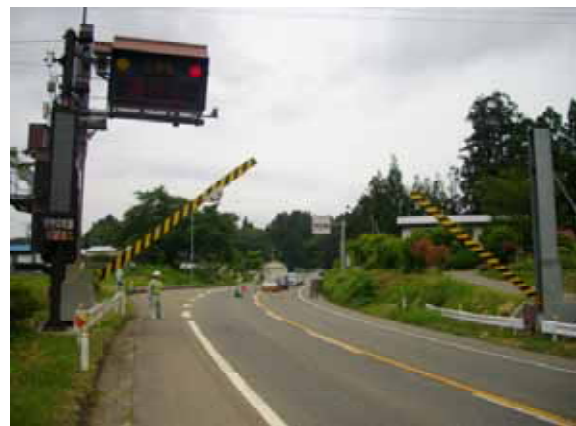
遮断機動作訓練状況