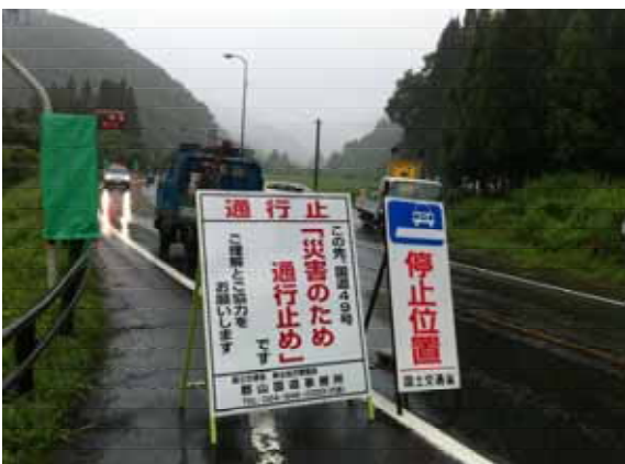
過去交通規制実施状況写真