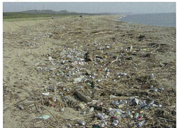
写真 雄物川河口に隣接する海岸の一般ゴミ