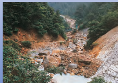
平成元年 土砂災害(姥湯温泉)