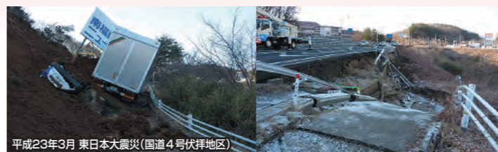
平成23年3月 東日本大震災(国道4号伏拝地区)