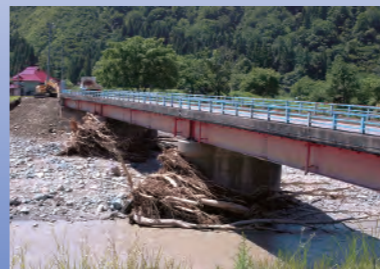
平成23年7月 新潟・福島豪雨(黒谷川)