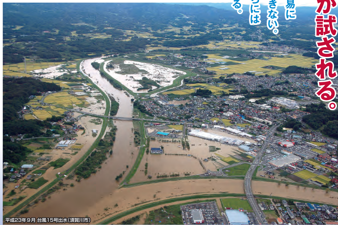
平成23年9月 台風15号出水(須賀川市)