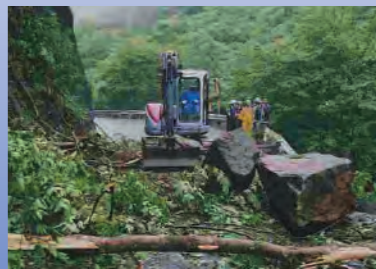
国道115号相馬福島道路

「連携」で地域を守る、 今、防災力が試される。 自然の脅威は容易に止めることができない。それでも、私たちにできることがある。