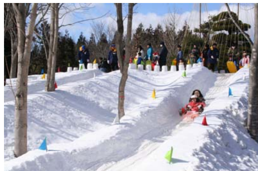
【かまくらまつり(南地区 ふるさと村)】