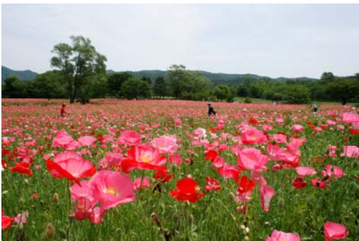
【ポピーまつり(南地区 花畑)】