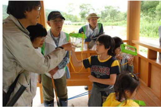
【自由研究応援講座(北地区 みちのく自然共生園)】