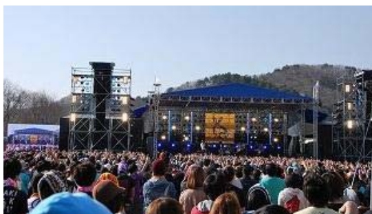
【アラバキロックフェス' 12(北地区 エコキャンプ場)】