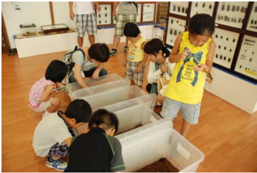
【ふれあい昆虫展(北地区 みちのく自然共生園)】