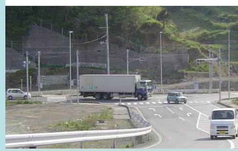
陸前高田市高田地区 国道45号の直角曲がり箇所