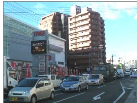
▲開通前(11月14日 午前8時)