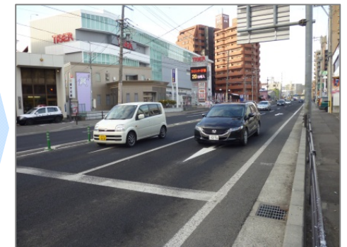
▲開通後(12月25日 午前8時)は交通がスムーズに