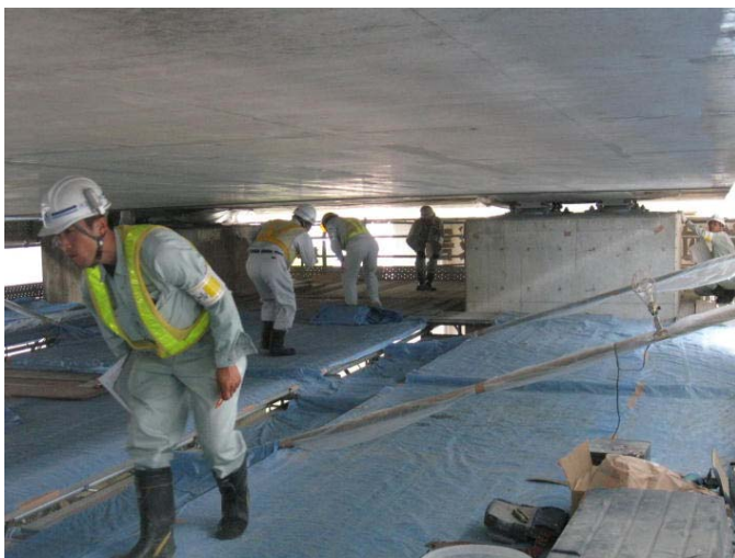
▲安全パトロール状況 工事現場に問題点等がないか点検します。