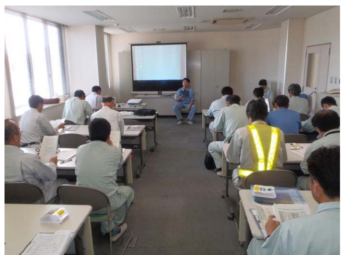
▲検討会状況 点検箇所の問題点等について議論したり、労働災害防止に関する講習を行います。