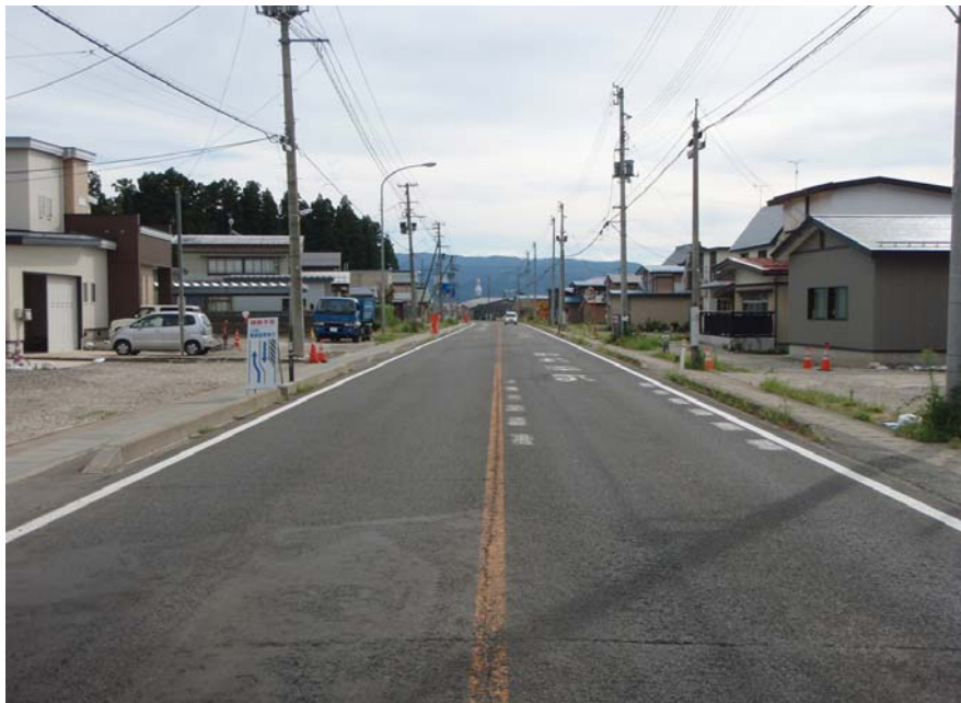
【横手市方面から新庄市方面を望む】